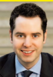
Christian Dürr MdB Fraktionsvorsitzender

am 26. Februar 2008 haben FDP und CDU in Hannover den Koalitionsvertrag unterschrieben. Zweieinhalb Jahre danach ist es Zeit für eine Zwischenbilanz.