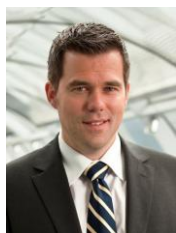
Dr. Gero Hocker

haben. Dann erst wird entschieden, ob wir unser Einvernehmen geben können oder nicht - so lange bleibt unsere kritische Haltung gegenüber der Elbvertiefung bestehen.